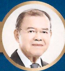
Dr. Supachai Panitchpakdi

Former Secretary-General of UNCTAD and Former Director-General of the World Trade Organization (WTO)